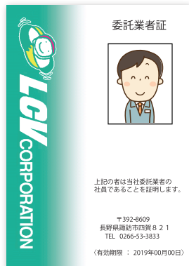
業務委託 (スタッフ)

エルシーブイでは 「全社員」「業務委託スタッフ」に ”身分証明書”の携帯を 義務づけています。